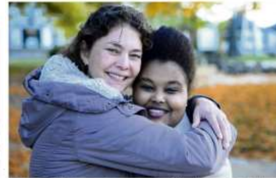
Omliep komende Buddy to Buddy een presentie van de moeders van de club zijn de moeders van Zutphen, Mijke, Carolien, Rwaida en Raghda.