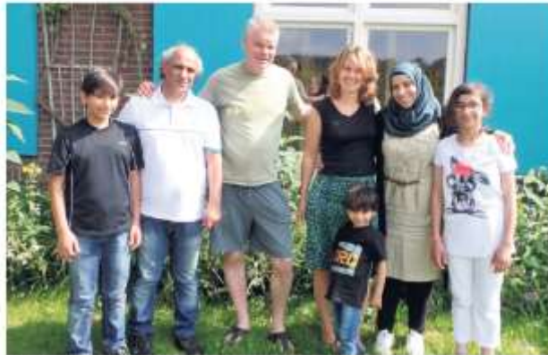
Vluchtelingen komen van de familie Roushidat naar de woonruimte van Meijer en Averel.