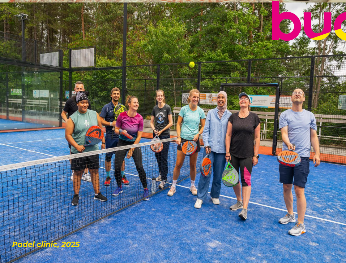
Padel clinic, 2025