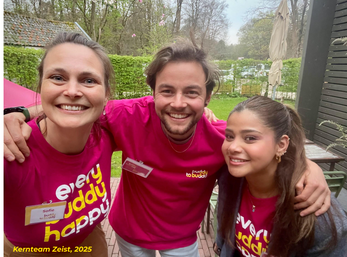
Kernteam Zeist, 2025