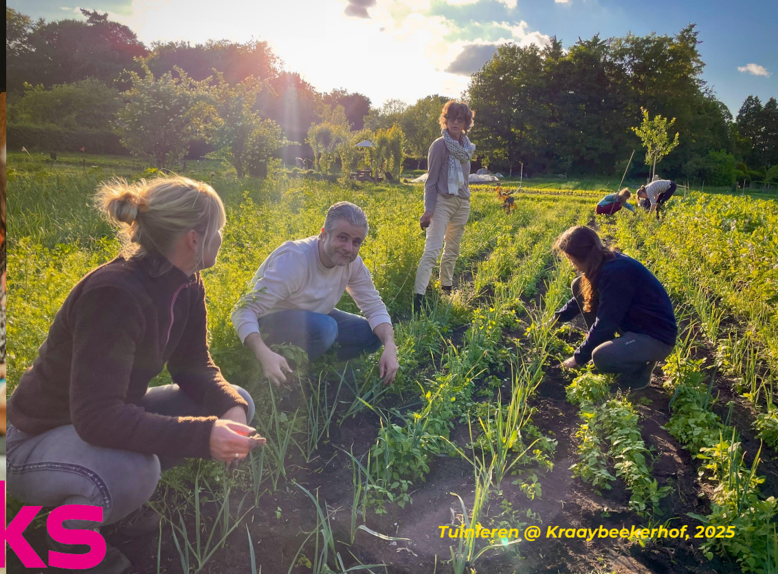
Tuinieren @ Kraaybeekhof, 2025