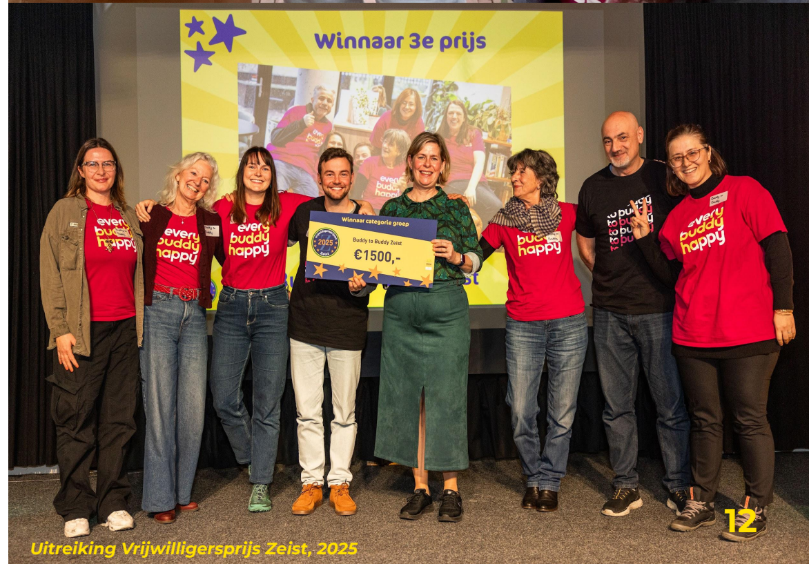
Uitreiking Vrijwilligersprijs Zeist, 2025