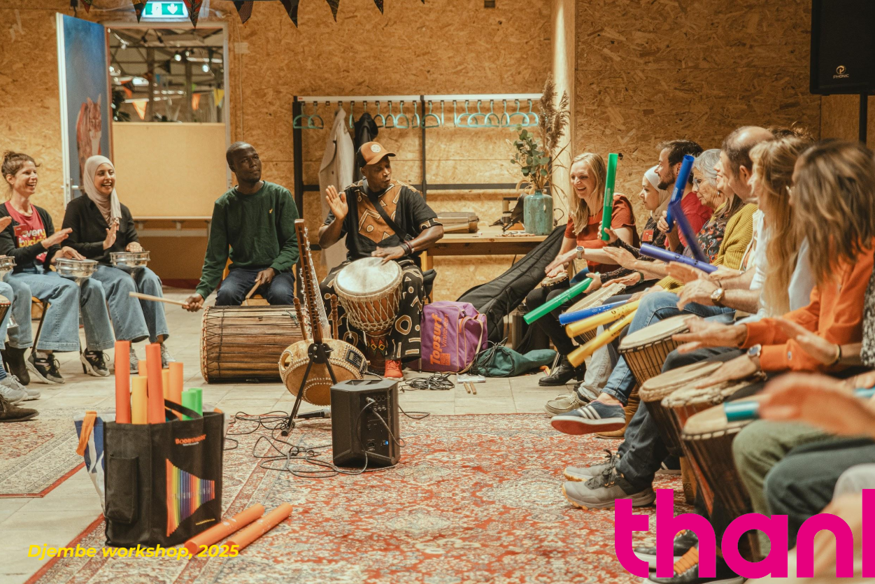
Djembe workshop, 2025