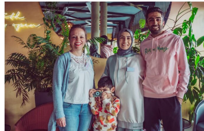
Buddy to Buddy komt naar Enschede. (Foto: Mirte Martinus) Foto:

Corine Engelbarts 07-02-24, 17:00 Laatste update: 08-02-24, 10:54