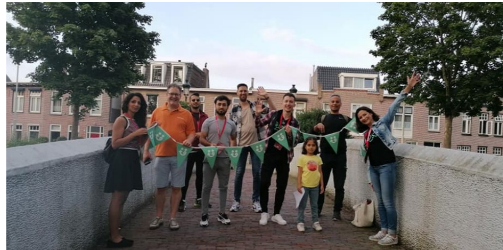
4 Bijlage 8: Overzicht pers- en communicatie uitingen Buddy to Buddy Breda

• NIEUWKOMER HEEFT MEER ZELFVERTROUWEN, IS MINDER EENZAAM EN ZELFREDZAMER.